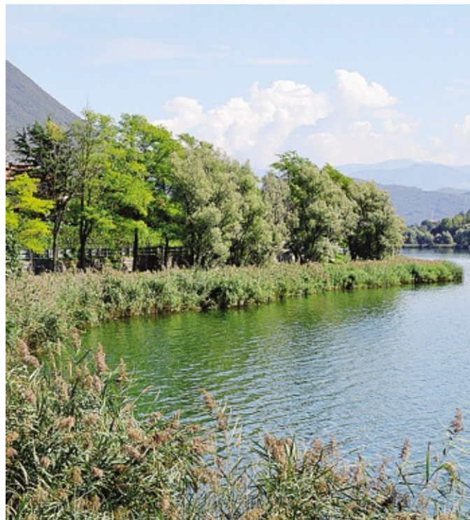
Il tratto del lago a Ranzanico dove sarà realizzato il camminamento